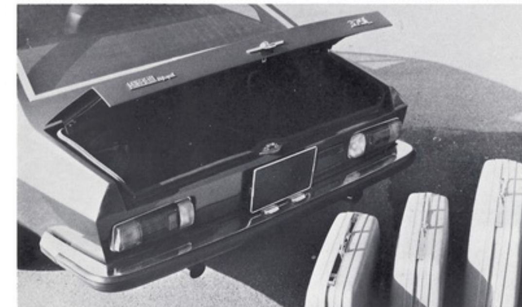
MONTEVERDI 375 L Faltreserverad im Kofferraum sorgt für viel Platz. Ganz in Moquette ausgelegt. Space saving spare wheel provides enormous capacity, complete carpet trim.

MONTEVERDI Perfektion von vorne bis hinten perfection from the front to the rear