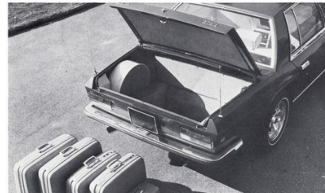
MONTEVERDI 375/4 Gepäckraum mit faltbarer Reserveventil und Platz für viel Gepäck. Ganz in Moquette ausgelegt. Luggage comp. with space-saver spare wheel enormous room with moquette carpet outfit.

MONTEVERDI für grosse Reisen und Individual-Komfort / individual comfort on big journeys