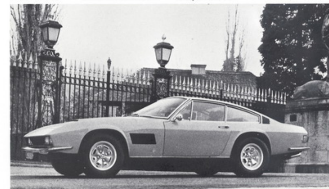
MONTEVERDI BERLINETTA 2-Plätzer Coupé / 2-seater Coupé (Nur auf Sonderbestellung / built to special order only)

MONTEVERDI Sicherheit auf Rädern safety on wheels