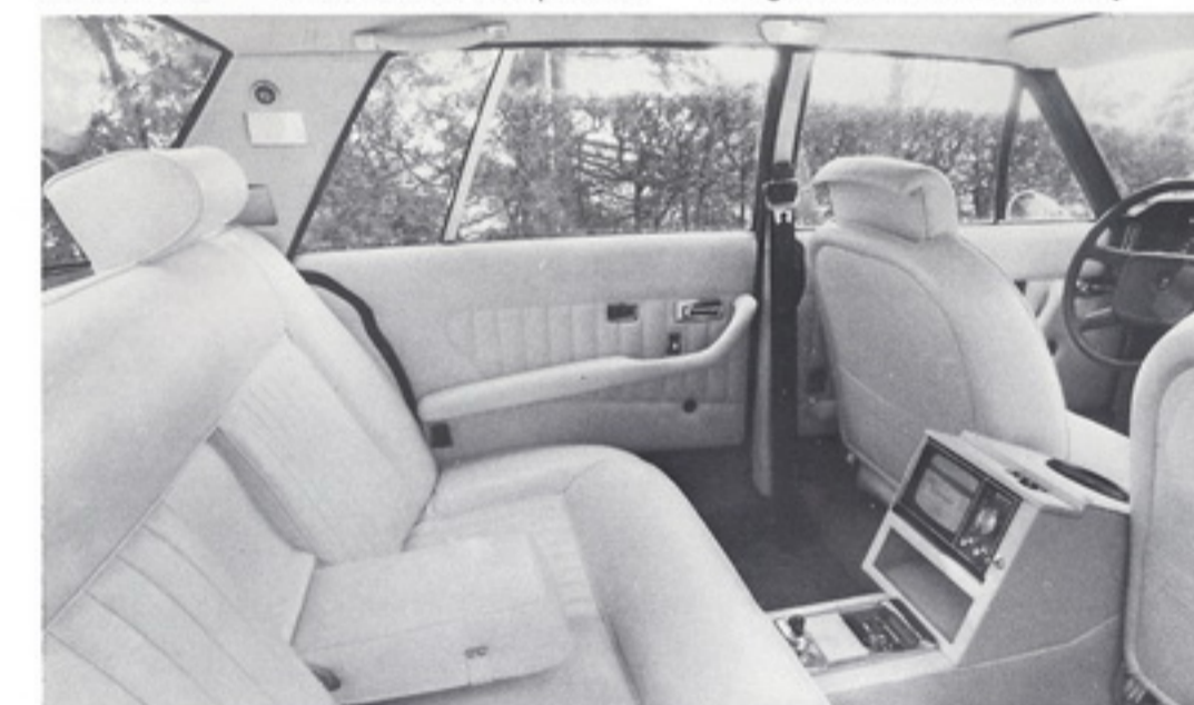
MONTEVERDI 375/4 Luxusausstattung für Fondpassagiere luxury interior trim for rear passengers

MONTEVERDI Automobil-Adel verpflichtet Obligation to Automobile nobility