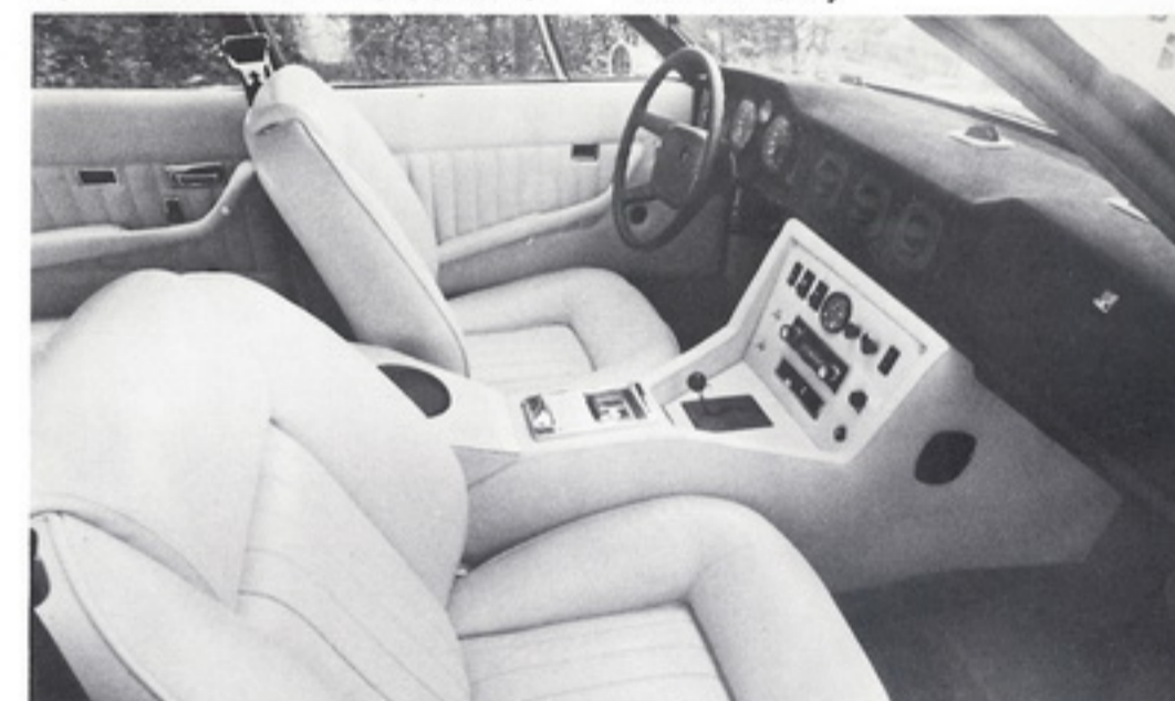
MONTEVERDI 375 L MONTEVERDI 375/4 Interior with instrument panel and switch board

MONTEVERDI funktionelle Schönheit functional Beauty