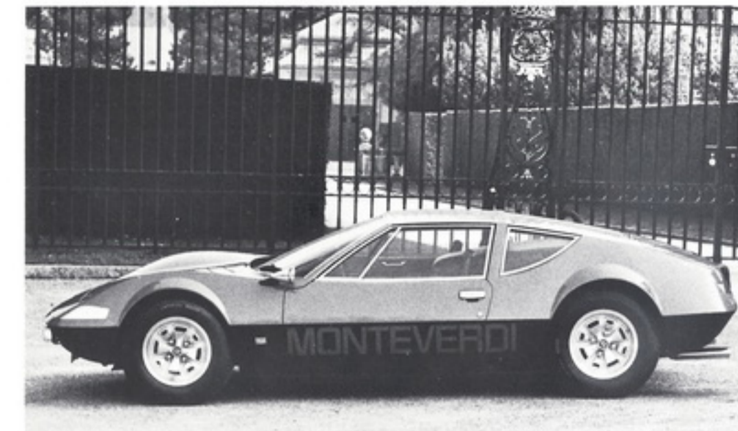
MONTEVERDI hai 450 GTS, 2-Plätzer Mittelmotor Coupé / 2-seater midengine Coupé (Nur auf Sonderbestellung / built to special order only)

MONTEVERDI der Name ... ein Begriff the brand ... the notion