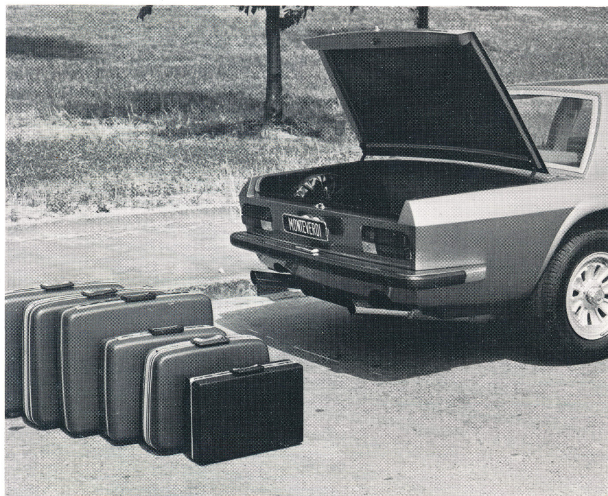
Elegante Hecklinie und grosser Kofferraum zeichnen den 375/4 aus.

Air conditioning Progressive power-steering Tinted glass Radio/tape, telescope electrical Steel sliding roof Automatically actuated-fire-extinguishing system HEMI engine (390 DIN bhp)