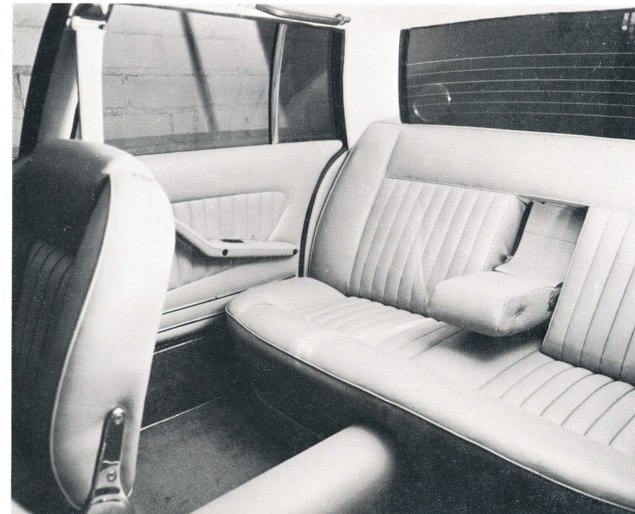
Bequeme Sitzbank hinten und grosser Beinraum ermöglichen angenehmes Reisen auch für 5 Personen.